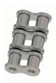
Nr. 4 (B)