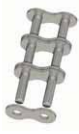
Nr. 7 (A)