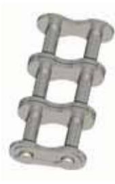
Nr. 11 (E)