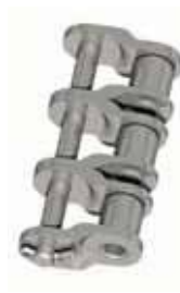
Nr. 12 (L)