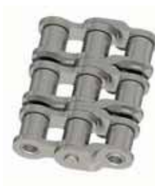
Nr. 15 (C)