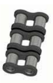
Nr. 4 (B)