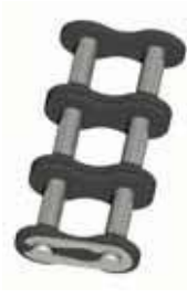
Nr. 11 (E)