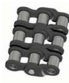
Nr. 15 (C)