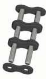
Nr. 7 (A)