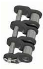
Nr. 12 (L)